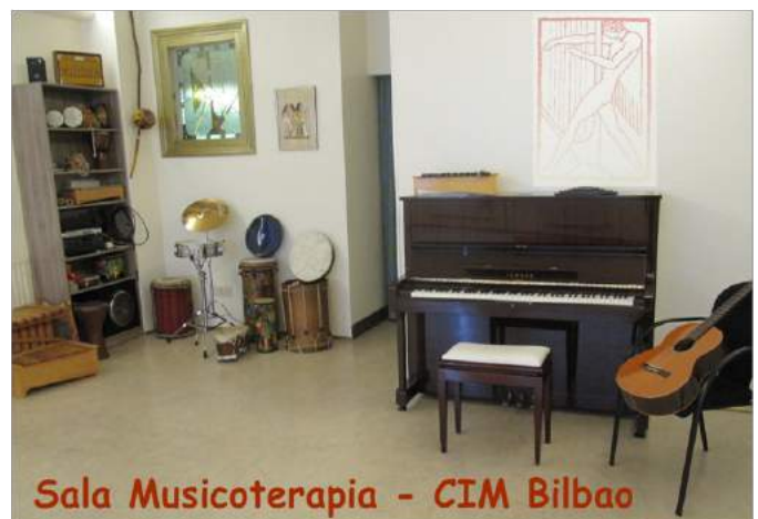
Sala Musicoterapia - CIM Bilbao